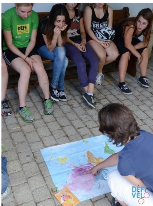
Figure 3 : Etape lors du parcours de Fleurier, avec le témoignage d'une voyageuse à vélo de la région.

Le canton de Neuchâtel a été parmi les précurseurs en Suisse en mettant en place le DÉFI VÉLO dans la foulée de Lausanne et Genève, dès 2014 déjà. Rapidement, des établissements du Littoral, du Val-de-Travers et des Montagnes neuchâteloises ont manifesté leur intérêt en participant à l'action ! Toutefois, certains établissements n'ont à ce jour toujours pas participé au projet. D'après l'expérience vécue dans d'autres cantons, un courrier officiel du canton à l'intention de la direction des établissements scolaires permet généralement de donner une impulsion positive et d'augmenter significativement le nombre de classes participantes. Infos : www.defi-velo.ch