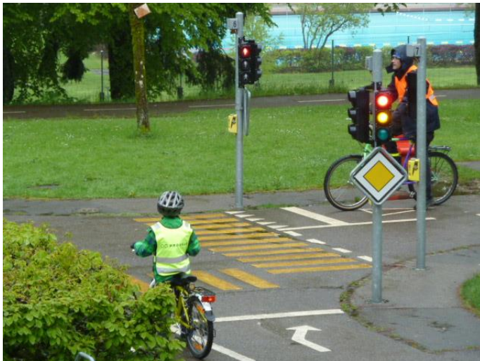
Figure 4 : Cours de conduite à vélo pour les enfants et leurs parents, au jardin de la circulation de La Chaux-de-Fonds.

En parallèle, PRO VELO et l'ATE proposent des cours à l'attention des familles dans les villes de La Chaux-de-Fonds et de Neuchâtel. Les enfants, âgés de 6 à 9 ans, effectuent des exercices en milieu protégé (collaboration avec l'éducation routière pour l'utilisation du jardin de circulation) pendant que les parents suivent un cours théorique. Ensuite, les parents et les enfants qui ont un niveau suffisant effectuent un parcours en milieu urbain accompagnés de moniteurs/monitrices. Cette prestation n'est actuellement pas proposée en dehors de La Chaux-de-Fonds et de Neuchâtel. Un nouveau cours destiné aux enfants qui ont déjà fait le cours avec les parents, mais qui viennent désormais seuls, a été mis sur pied récemment.