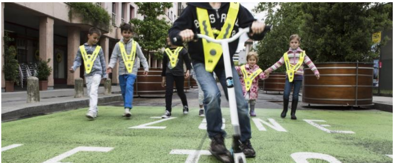
Figure 5 : Le plan de mobilité scolaire vise à promouvoir la mobilité active chez les enfants.

Le TCS et PRO VELO pourront épauler l'ATE (ou tout autre bureau spécialisé proposant la même qualité de prestation) dans cette démarche si nécessaire. Le PMS est proposé aux communes car ce sont en général elles qui en assurent le financement. Infos : mobilitescolaire.ch