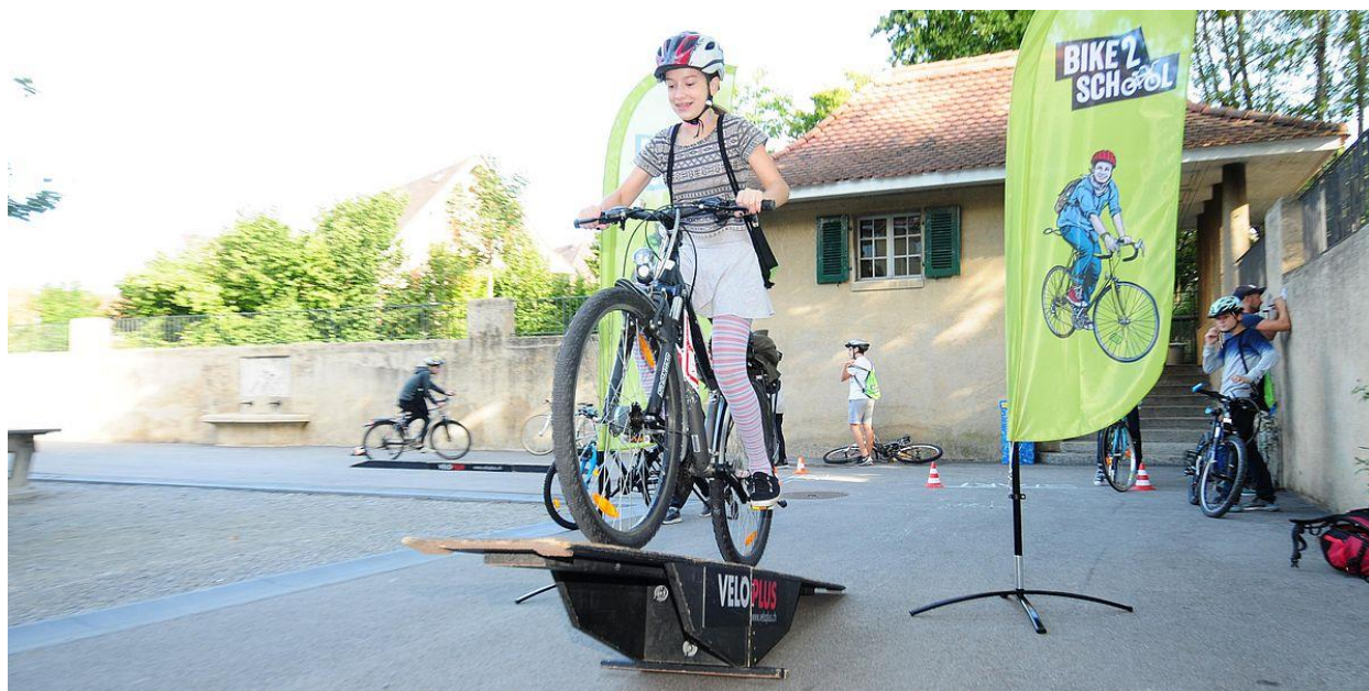
Figure 2 : Exemple d'activités ludiques proposées dans le cadre de Bike2school.

Selon le site internet bike2school.ch , 21 cantons et demi cantons prennent en charge les frais de participation, soit 80.- par classe participante. Le canton de Neuchâtel ne fait pas encore partie de cette liste.